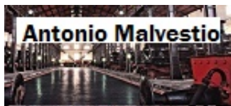
7 GIORNI AL FORUMPIETRARSA LE INTERVISTE DI FERPRESS

Trasporto su ferro: Sciarrone, con la rete AV/AC porteremo dall'anno prossimo i megatrailer nel Sud Italia